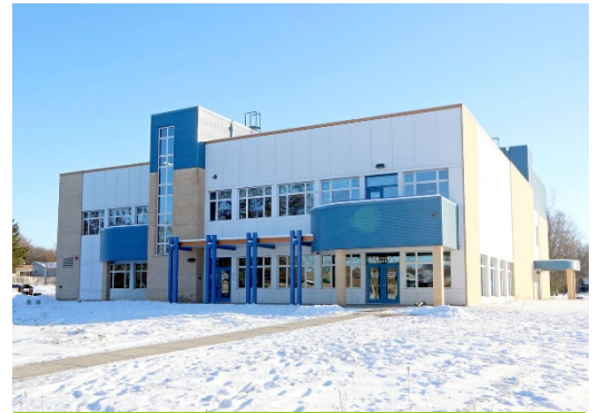
Director: Hong Tran

En la Escuela Intermedia Badger Rock, preparamos a todos los estudiantes para la universidad, una profesión y la comunidad a través del aprendizaje basado en proyectos con un enfoque en la agricultura urbana. A través del aprendizaje basado en proyectos, los estudiantes integran el conocimiento de las cuatro materias esenciales (matemáticas, ciencias, estudios sociales, artes del lenguaje) para encontrar soluciones a los problemas del mundo real. Mediante nuestro enfoque en la agricultura urbana, los estudiantes aprenden importantes conocimientos básicos para la vida referentes a la comunicación, la colaboración y el auto bienestar. También estamos impulsados por nuestros valores fundamentales de lugar, relevancia cultural, sostenibilidad, resiliencia, diseño e indagación. Estos valores fundamentales impregnan cada acción que tomamos incluyendo la creación de nuestro Plan de Mejoramiento Escolar (SIP, por sus siglas en inglés), que describe las estrategias clave en las áreas de lectoescritura, matemáticas, cultura, ambiente escolar, enseñanza, retos, participación integral y participación familiar.