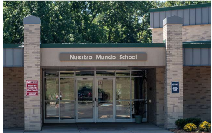
Director: Josh Forehand

La Escuela Comunitaria Nuestro Mundo ofrece una experiencia educativa única para los estudiantes desde kínder hasta quinto grado. Nuestro personal culturalmente diverso está dedicado a desarrollar el bilingüismo y la lectoescritura bilingüe en todos los estudiantes. Nuestros estudiantes se esfuerzan por la excelencia académica a través de la combinación de altos estándares educativos, enseñanza bilingüe de doble inmersión y una gran cantidad de recursos culturales. Creemos que una excelente educación viene de una excelente enseñanza, de relaciones positivas significativas con los estudiantes y de conexiones fuertes con las familias. Nuestros esfuerzos de mejorar la escuela este año están centrados en desarrollar la resiliencia en nuestros maestros, estudiantes y familias.