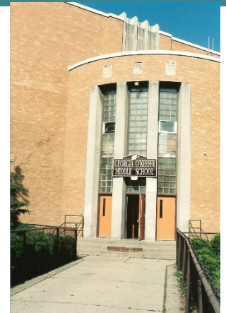
Director: Tony Dugas

La comunidad de O'Keeffe se compromete a dar su "MEJOR" esfuerzo por identificar e interrumpir las desigualdades educativas a través de una colaboración deliberada y llevando a cabo toma de decisiones para garantizar que cada alumno reciba lo que necesita para desarrollar todo su máximo potencial académico y social.