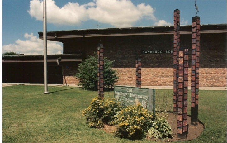
Director: Brett Wilfrid

Estamos construyendo con mucha información de cultura y ambiente escolar y profundizando nuestra labor alrededor de la Justicia Restaurativa. Nuestros datos académicos mostraron un aumento en matemáticas durante nuestro primer año, utilizando el currículo Bridges. Mientras tanto, nuestro trabajo en equipos dejó en claro que las unidades rigurosas y alineadas a los estándares, planificadas con anterioridad con tareas rigurosas y relevantes, son un área que merece enfoque. El deseo de asegurar que el contenido fuera relevante y reflejara nuestra postura antirracista, se vio como resultado en las lecciones y unidades que no eran tan rigurosas o “estrictas” tal como lo necesitamos. Es en el enfoque al planificar las unidades de instrucción de lectoescritura de alta calidad y de justicia restaurativa, donde necesitamos estar.