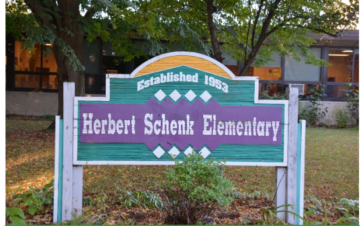
Directora: Susan Abplanalp