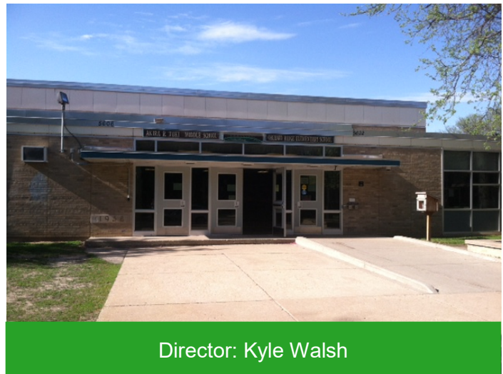
Director: Kyle Walsh

Somos una comunidad que trabaja y aprende en conjunto para cultivar una cultura de excelencia y equidad para todos nuestros estudiantes y el personal. Estamos comprometidos a desarrollar sólidas alianzas de aprendizaje con nuestros estudiantes de enfoque donde los estudiantes se destacan en un plan de estudios basado en los estándares, participan en experiencias de aprendizaje colaborativo y experimentan un aprendizaje socioemocional que los prepara para tener un razonamiento crítico para estar preparados para la universidad, una profesión y la comunidad. Nuestro trabajo está guiado por nuestro Plan de Mejoramiento Escolar y un progreso monitoreado a lo largo del año.